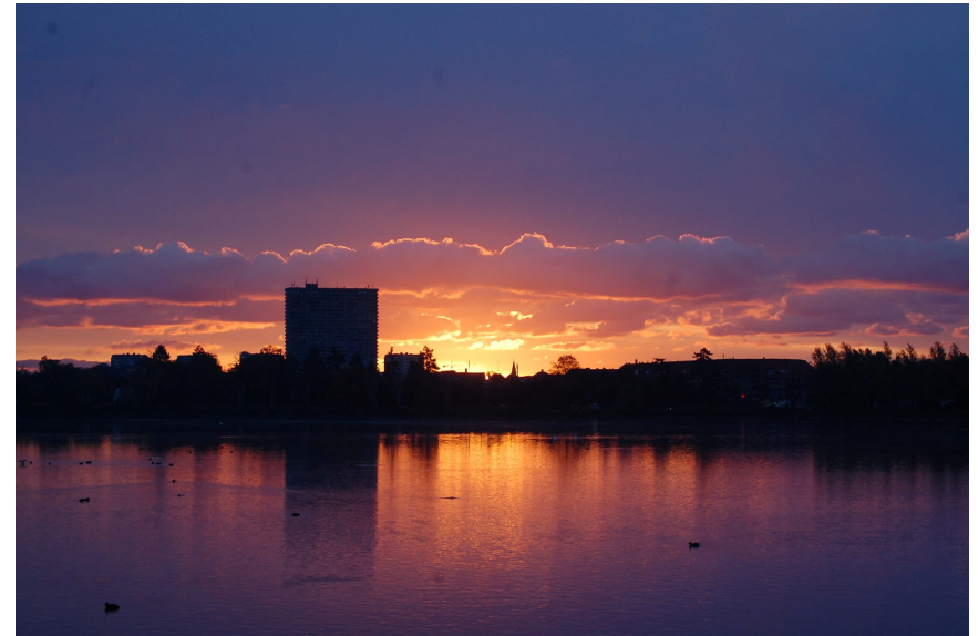
Nana Green "Solopgang og skyer"